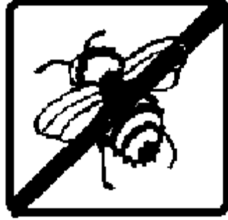
16. Tóxico para abejas