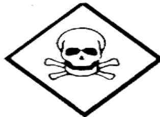
Extremadamente tóxico (Ia) Altamente tóxico (Ib)