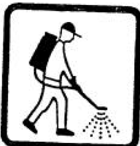
6. Aplicación de líquidos y sólidos en disolución