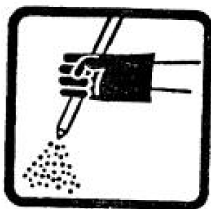
5. Aplicación especial de sólidos