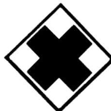
Moderadamente tóxico (II)