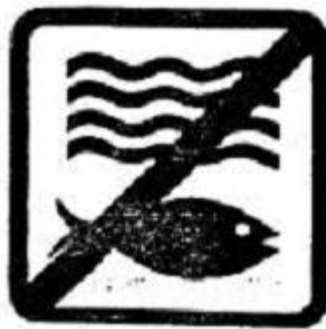
17. No contamine fuentes de agua