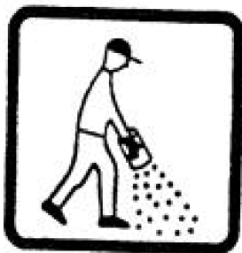
4. Aplicación de sólidos para uso directo