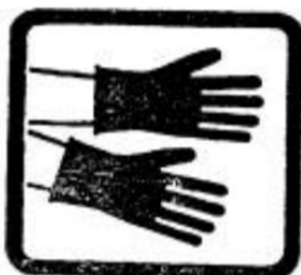
7. Utilice guantes de protección