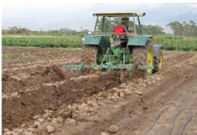
Tractores y otra maquinaria.