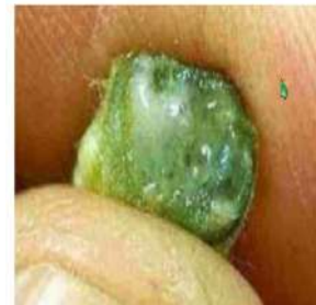
Gotas blancuecinas en la periferia del tallo al exprimirlo

Síntomas y Daños: En plantas en activo crecimiento, un síntoma inicial es el amarillamiento de las hojas más jóvenes de la planta, seguido por marchitez y secamiento; los síntomas son progresivos desde las hojas más jóvenes hasta las más viejas.