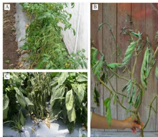
(B) y chile (C).

Pseudomonas ricini (Archibald) Robbs 1954