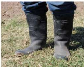
Botas de seres humanos y circulación de animales.

La infección causada en cultivos de tomate y en general a la mayoría de las hortalizas debida a este fitopatógeno, ocurre por medio de la interacción entre el nematodo y la bacteria Ralstonia solanacearum , debido a que durante su ataque, dicho fitoparásito causa heridas en el cultivo, facilitando de este modo el ingreso de la bacteria a través de las mismas. La bacteria va progresivamente colonizando los tejidos hasta lograr acceder al sistema vascular, donde se reproduce rápidamente diseminándose por toda la planta y produciendo los típicos síntomas de marchitez. El ciclo se cierra cuando la bacteria vuelve al suelo, en donde se mantiene como organismo saprofito (organismos que obtienen su alimento de materia orgánica en descomposición), hasta que vuelve a infectar a un nuevo hospedero susceptible o mantenerse inadvertida en algún hospedero asintomático durante varios años.