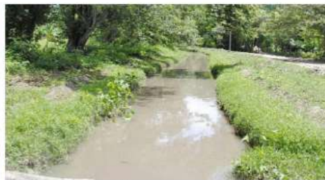
Irrigación o agua que fluye.