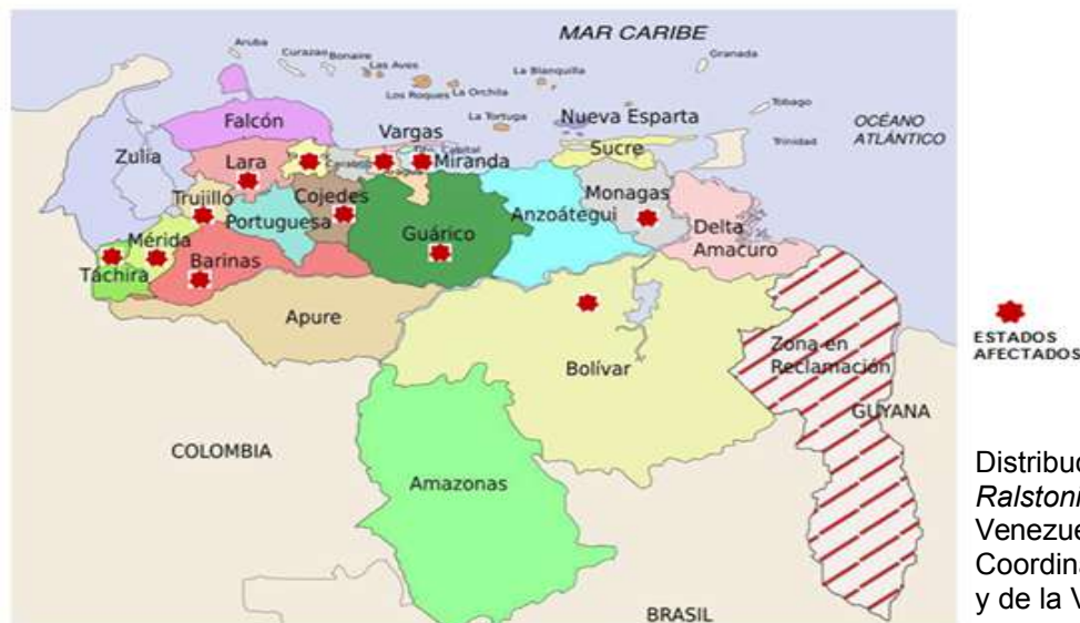
Distribución Geográfica de la Ralstonia solanacearum en Venezuela.

En Venezuela, se ha reportado en cultivos de papa en los estados: Lara, Monagas, Mérida, Trujillo en cultivo de tomate, en los estados Aragua, Carabobo, Cojedes, Yaracuy y Guárico y en cultivos de bananos, en los estados Aragua, Carabobo, Barinas, Bolívar, Miranda y Táchira.