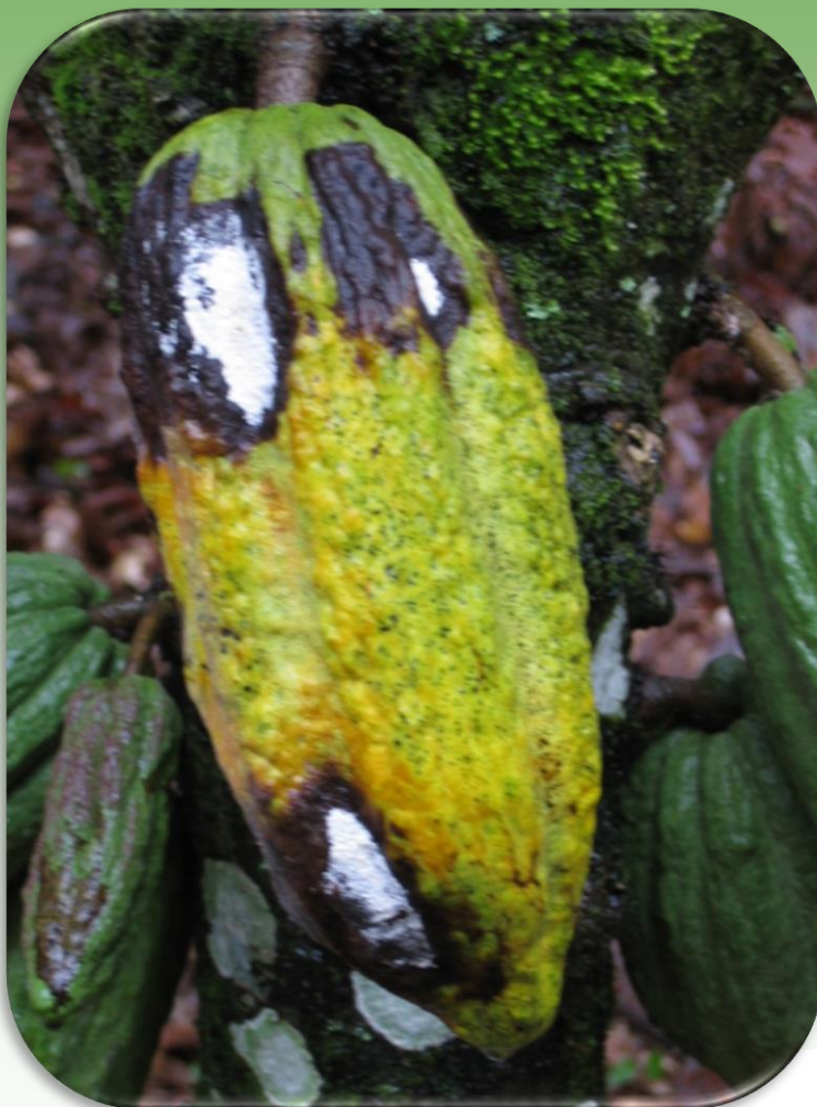
Presencia de micelio